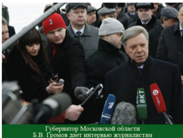
Губернатор Московской области Б.В. Громов дает интервью журналистам

Россия, Москва, 21 год спустя. На Поклонной Горе, у Монумента Победы – ветераны войны в Афганистане, представители общественных организаций, военнослужащие Кремлевского полка. Здесь же – Губернатор Московской области Борис Громов. Тот самый генерал Громов. Почтить память погибших воинов – их священный долг. Мероприятия в память о воинах-афганцах проводятся каждый год. В этом году их инициаторами выступили Всероссийская общественная организация ветеранов «Боевое братство» совместно с Всероссийской общественной организацией морских пехотинцев «Тайфун».