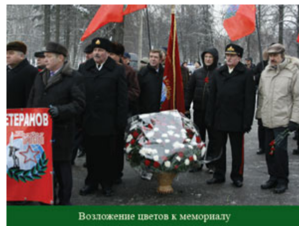
Возложение цветов к мемориалу

О них сегодня говорил Герой России Борис Громов. О них и о тех, кто прилагает все усилия для сохранения памяти не вернувшихся с полей сражений и кто оказывает помощь семьям военнослужащих сегодня. Борис Громов высоко оценил деятельность Союза «Маринс Групп» по содействию ветеранам боевых действий и предоставлению им рабочих мест: «Я могу только поддерживать такую политику, это замечательно», – сказал он. Кроме того, он отметил, что усилиями «Боевого братства», НП «Союз «Маринс Групп» и Всероссийской общественной организацией морских пехотинцев «Тайфун» было проведено уже много мероприятий, и не исключено, что в ближайшем будущем возможен крупный совместный проект.