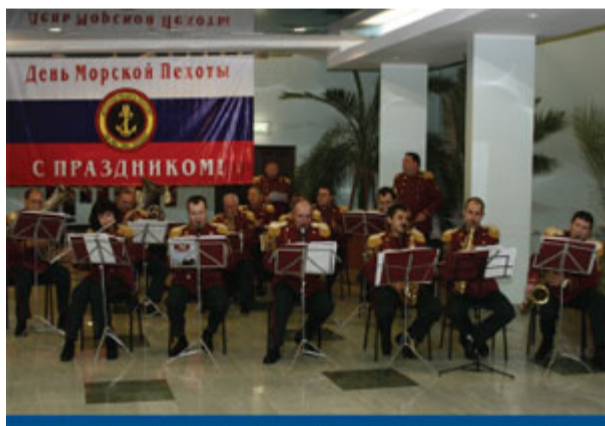
Гостей встречал духовой оркестр МЧС