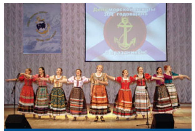
Кубанский казачий хор «ЛЮБО»