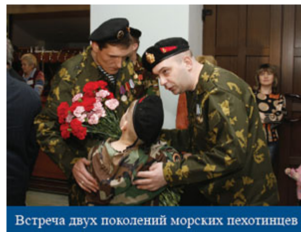
Встреча двух поколений морских пехотинцев