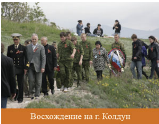
Восхождение на г. Колдун

5 мая 2009г. в 12.00 на г. Колдун п. Мысхако прошел День памяти. В рамках данного мероприятия состоялось открытие памятника защитникам «Малой Земли», его второе рождение. История этого памятника длительная. Бои давно закончились, но борьба с местной бюрократией продолжалась долгие годы. К счастью, к вопросу подключились общественные организации, в том числе и Союз «Маринс Групп», который на протяжении долгих лет оказывает активную поддержку морской пехоте. А ведь в числе павших защитников Мысхако было 23 морпеха.