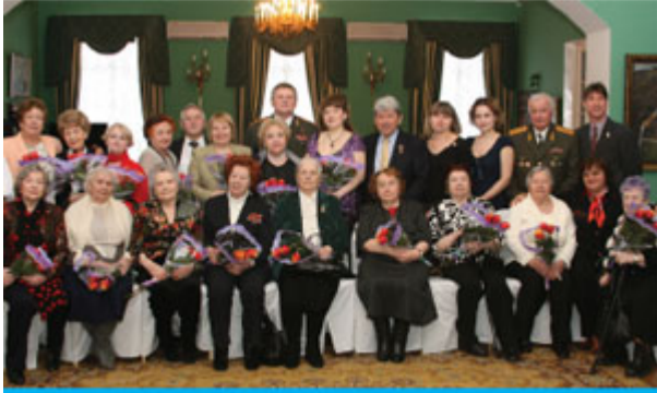
Участники праздничного приёма

5 марта в канун международного Женского дня в мраморной гостиной Культурного Центра Вооружённых Сил РФ собрались вдовы высших военачальников РФ. Инициатором торжественного приёма стало руководство Клуба военачальников РФ совместно с компаниями-попечителями.