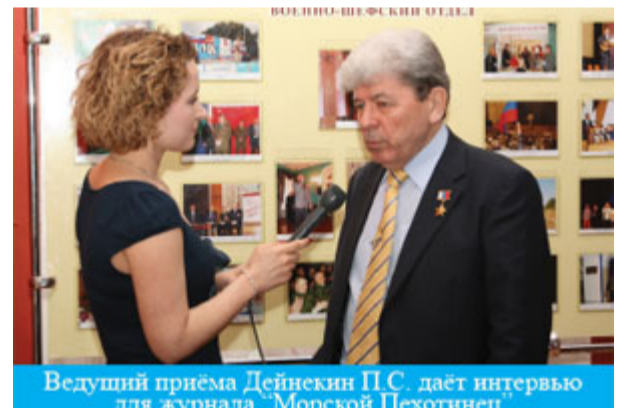
Ведущий приёма Дейнекин П.С. даёт интервью для журнала "Морской Пехотинец"

Участие Союза в социально-патриотической работе отметил генерал армии, герой России, первый Главком ВВС РФ Пётр Степанович Дейнекин: