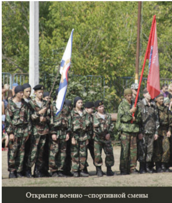
Открытие военно-спортивной смены

30 июля в Калужской области стартовала лагерная военно-спортивная смена. В лагере, который так и называется - «Смена» - в течение 21 дня дети и подростки из Калуги и области будут проходить физическую, общевойсковую, альпинистскую подготовку, получать знания по медицине и психологии, изучать основы выживания и военной истории.