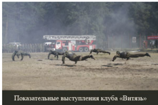
Показательные выступления клуба «Витязь»

После торжественного открытия смены у всех желающих была возможность ознакомиться с вооружением спецназа. Снайперские винтовки, пулеметы и гранаты - далеко не единственное, что заинтересовало детей и взрослых. Новый номер журнала «Морской пехотинец» сразу завоевал всеобщее внимание и разошелся в считанные секунды.