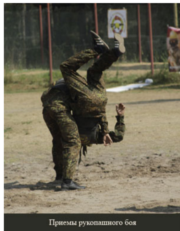
Приемы рукопашного боя