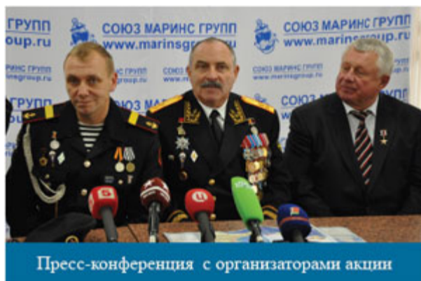
Пресс-конференция с организаторами акции

1 октября в Москве, на Речном вокзале, встречали ветеранов флота, официальных представителей Швейцарии и Белоруссии, – участников международного проекта «Морское братство – нерушимо!». Организаторами которого выступают: Союз «Маринс Групп», посольство Республики Беларусь, Союз Адмиралов России, ВОО МП «Тайфун», фестиваль «100 городов мира», Российский творческий союз работников культуры Санкт-Петербурга. Вместе с ними на теплоходе «Александр Суворов» прибыли юные участники V Межвузовского фестиваля «Морфест-2011» из морских учебных заведений 30 регионов России и ближнего зарубежья, которые активно подхватили идею совместного участия в возведении на белорусской земле монумента морякам.