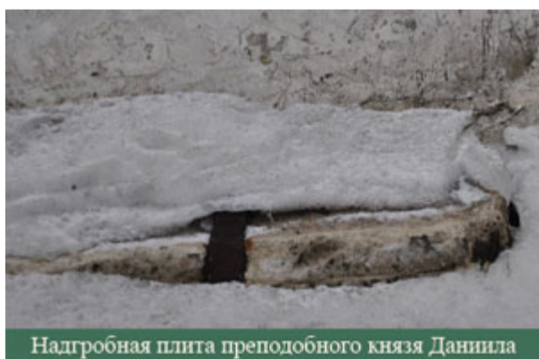
Надгробная плита преподобного князя Даниила