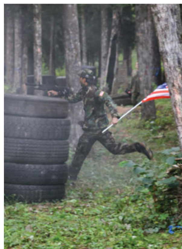
Бегом в штаб

...Команды определены, экипировка выдана. Участники военно-спортивной игры «Черные береты» 8 команд по 5 человек, у каждой свое название. «Лига мира» (сборная ДИИР, Административного департамента, Агрохолдинга, Департамента правового обеспечения строительства коттеджных поселков), «Подмосковные партизаны» (ККЗ), «Морская пехота» (Департамент управления проектами коттеджных поселков); «Стройбат» (Департамент строительства коттеджных поселков); «Убойная сила» (Финансовый департамент ЦО - Москва); «Неудержимые» (ДЦ «Муравей»); «Динамит» (Управление строительства); «Легион» (Департамент правового обеспечения реализации земельных активов).