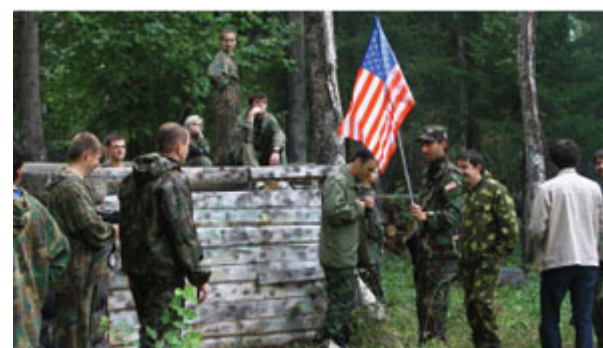
Подготовка к третьему этапу игры

Чтобы хо-ро-шо ЖИТЬ, надо хорошо себя чувствовать: энергично - на уровне тела, стабильно - на уровне эмоций, продуктивно - на уровне ума. Это формула - стиль жизни сотрудников предприятий Союза «Маринс Групп»: людей молодых, энергичных, продуктивных и перспективных.